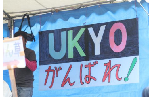
ホームチーム「チーム右京」の応援