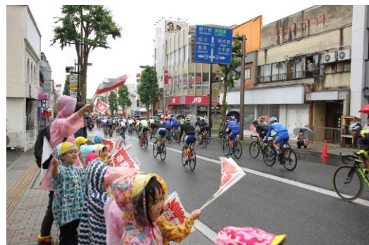
飯田駅前からのパレード走行