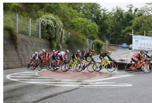
急カーブの通称「T.O.J.コーナー」