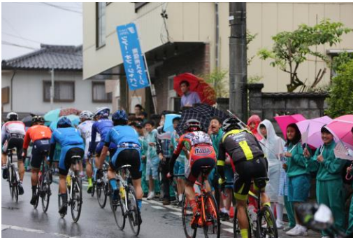
沿道の声援を受けて