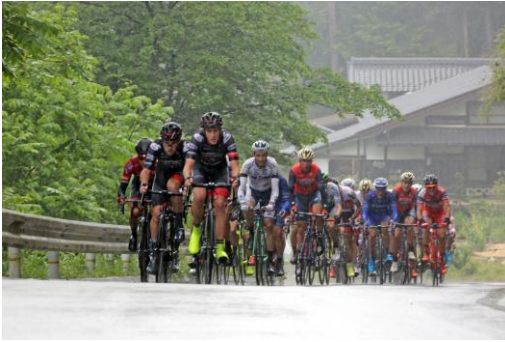
周回コースでの熱戦