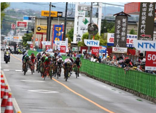
ゴール前のデッドヒート