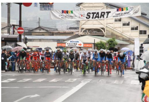
スタート地点の飯田駅前

第20回ツアー・オブ・ジャパン南信州ステージを開催した。また、レースの実施に併せて、飯田市長を始め市民・自転車競技ファンによる「パレード走行」、コース上に選手への応援メッセージを書く「チョークイベント」、また地元保育園児、小・中学生を対象に授業の一環として観戦の呼びかけを実施するなど、地元住民や自転車競技ファンがより身近に自転車競技および自転車の魅力に触れられる機会を提供した。またレースの様様を地元ケーブルテレビや地元FMラジオ、アベマTVフレッシュにて中継放送を行うなど、情報発信に努めた。