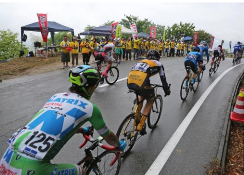
焼肉ポイントでの応援