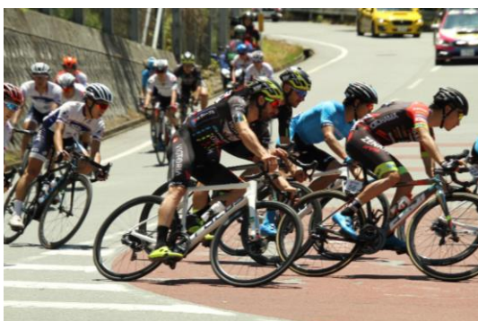
急カーブの通称「T O Jコーナー」