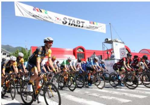
スタート地点の飯田駅前

2019ツアー・オブ・ジャパン南信州ステージを開催した。また、レースの実施に併せて、飯田市長を始め市民・自転車競技ファンによる「パレード走行」、コース上に選手への応援メッセージを書く「チョークイベント」、また地元保育園児、小・中学生を対象に授業の一環として観戦の呼びかけを実施するなど、地元住民や自転車競技ファンがより身近に自転車競技および自転車の魅力に触れられる機会を提供した。またレースの様様を地元ケーブルテレビや地元FMラジオ、インターネットスポーツメディア「SPORTS BULL」にて中継放送を行うなど、情報発信に努めた。