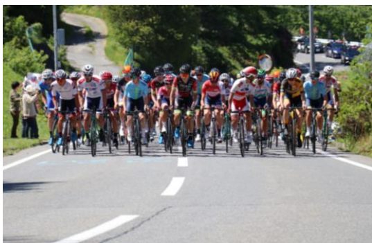
周回コースでの熱戦