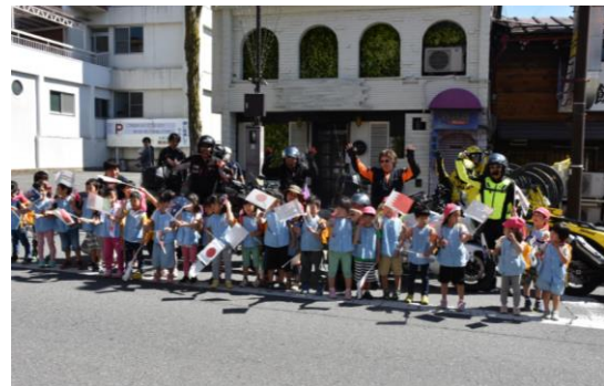
パレード応援風景