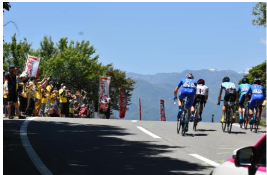
沿道の声援を受けて