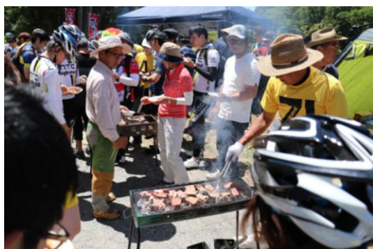
焼肉ポイントでの応援