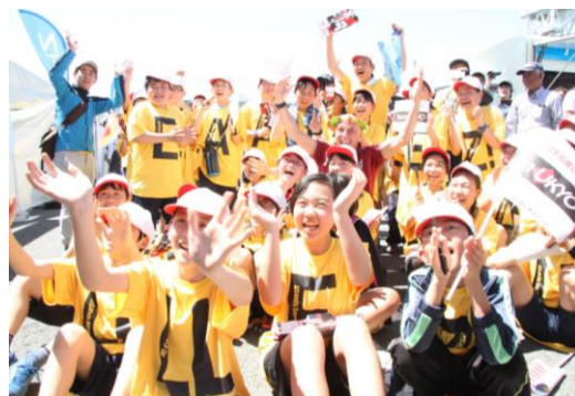
ホームチーム「チーム右京」の応援